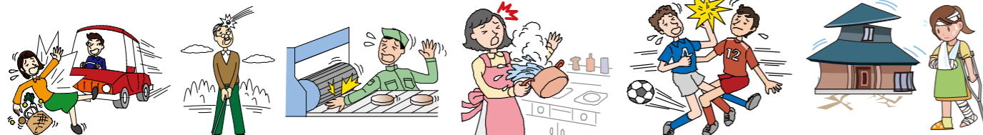
車にはねられてケガ ゴルフ中のケガ お仕事でのケガ 料理中のヤケド スポーツ中のケガ 地震によるケガ

日本国内外を問わず、日常生活のほとんどすべての急激かつ偶然な外来の事故によるケガ(注1)や特定感染症※2を発病した場合に、死亡・後遺障害保険金(注2)、入院保険金、通院保険金をお支払いします。